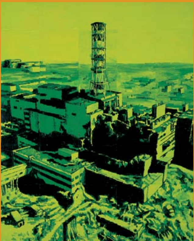
Miha Štrukelj (1973) Brez naslova, 2001 (Sans titre - Zonder titel - Untitled); 100 x 80 cm

Exposition | Tentoonstelling | Exhibition Hôtel de Ville de Bruxelles Stadhuis van Brussel City Hall of Brussels Grand-Place | Grote Markt 27/02 > 18/05/08