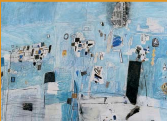
Gabrijel Stupica (1913 – 1990) Atelje, sd (Atelier - Studio); 90 x 126,5 cm